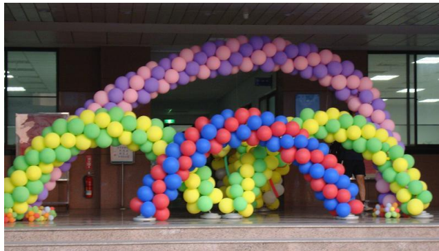
↑ 氣球拱橋，這是我們在社團時間時，大家共同努力所做出來的喔!

在生活中所看到的事物、卡通人物、交通工具以及花草樹木等等，幾乎都可以用氣球在經過巧手後，就誕生了，而且還非常神似喔! 但想要做出這些漂亮造型的氣球，要具備不怕「氣球」的條件。因為，在製作氣球的過程中，有可能因為某些特殊的因素，而使氣球「碰」的一聲破掉，同時也會發出巨大的聲響。要做出完美的作品，就要克服以上種種困難，但這都是值得的! 只要妳學會如何做出漂亮造型的氣球，以後還可以靠這個賺錢呢! 選擇汽球造型社，會使你在在社團中更快樂、更有趣喔!