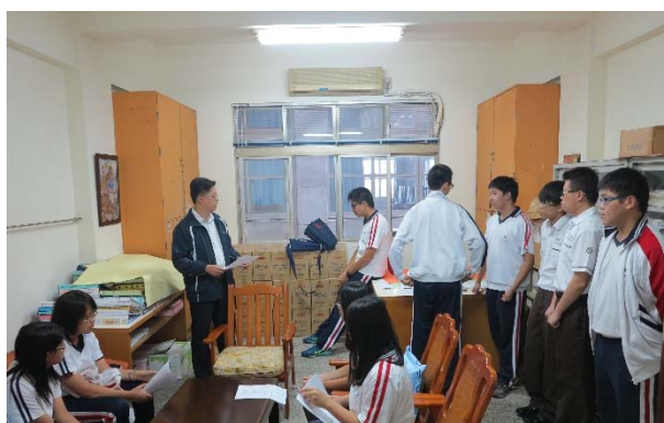
高二股長生命教育知能培訓