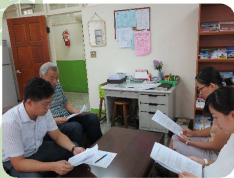
適性輔導小組 期初會議 104.09.18