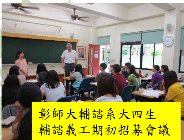
彰師大輔諮系大四生 輔諮義工期初招募會議