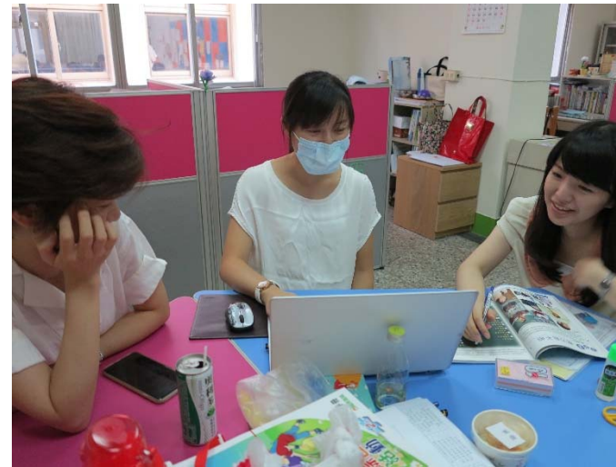
國二綜合活動二課程研討會議