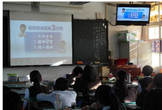
課程: 我是自己的主人(非關男女) 國二家政老師提供