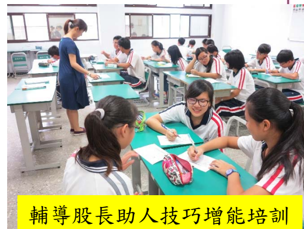
輔導股長助人技巧增能培訓