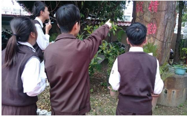
課程: 始業輔導 認識校園環境