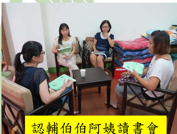
認輔伯伯阿姨讀書會