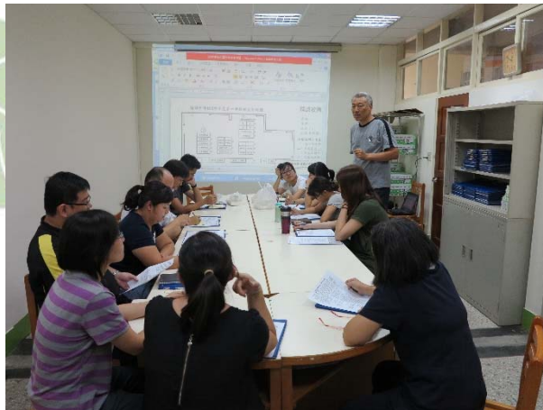
國一綜合活動二課程研討會議