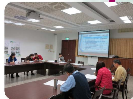
國中生涯發展教育 委員會期末會議 105.01.15.