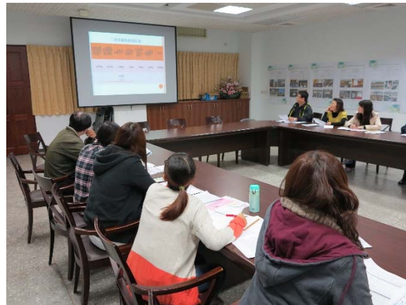
國三導師適性輔導選填志願輔導增能研討會議