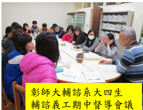
彰師大輔諮系大四生 輔諮義工期中督導會議