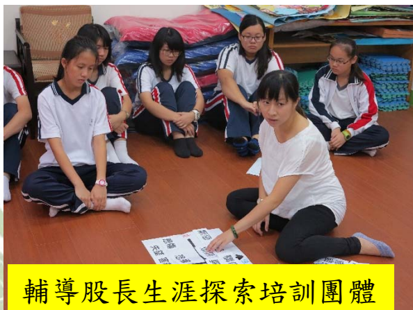
輔導股長生涯探索培訓團體