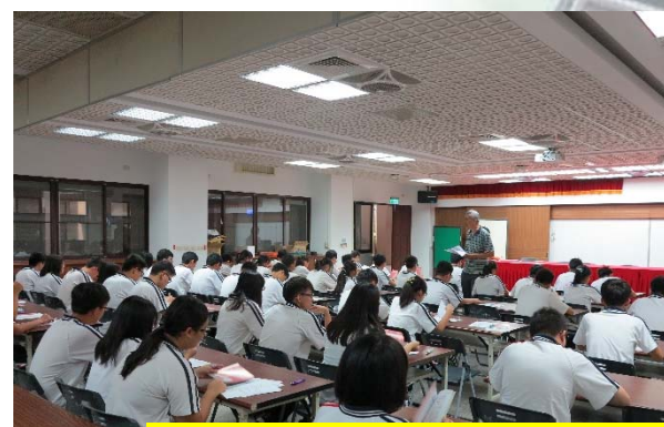
輔導股長幹部訓練研習