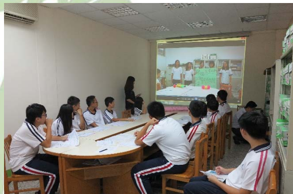
高一股長生涯闖關知能培訓