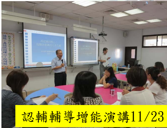
認輔輔導增能演講11/23