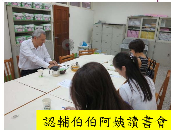
認輔伯伯阿姨讀書會