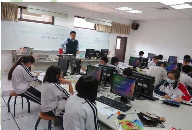
國三綜合活動課程-彰化區高中、職業類科介紹(網路查詢學校科別)