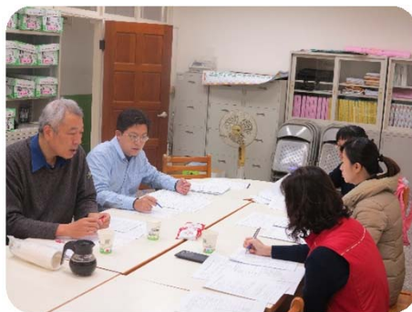
適性輔導小組 期末檢討會議 105.01.12.