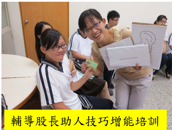
輔導股長助人技巧增能培訓