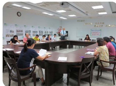
國中生涯發展教育 委員會期初會議 104.09.04.